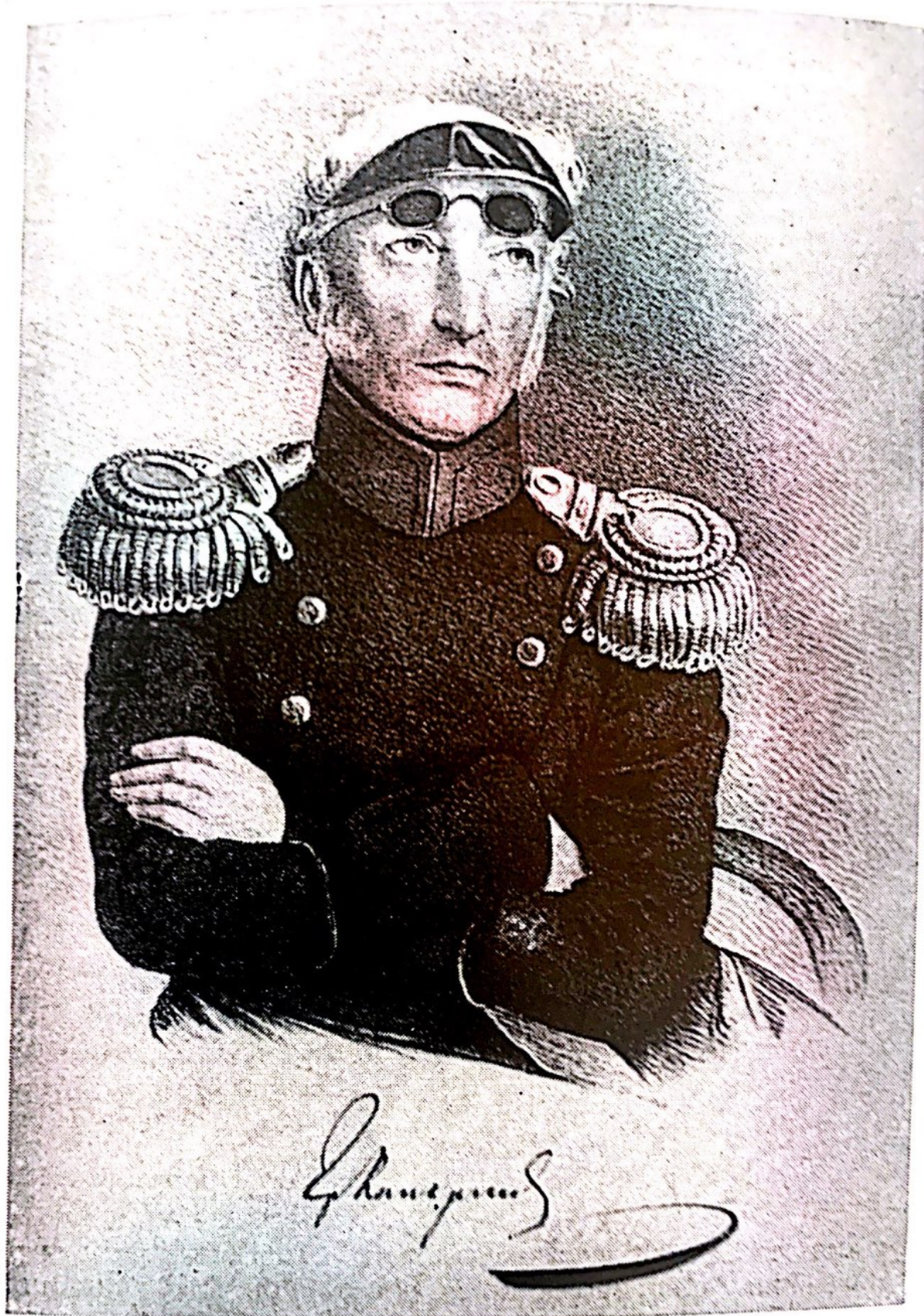
Министр финансов Е. Ф. Канкрин. E. F. Kankrin, Minister for Finance