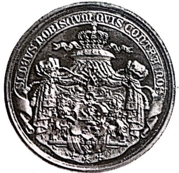
Принц Александр Гессенский. Медаль раб. К. Лоренца. Prince Alexander of Hessen. Medal executed by K. Lorentz.

правлящих домов Европы и составил подробные каталоги коллекций, успев опубликовать два из них 1 . Пожалуй, следуя именно его примеру, несколько русских великих князей 70—80-х гг. XIX в. увлеклись составлением нумизматических коллекций.