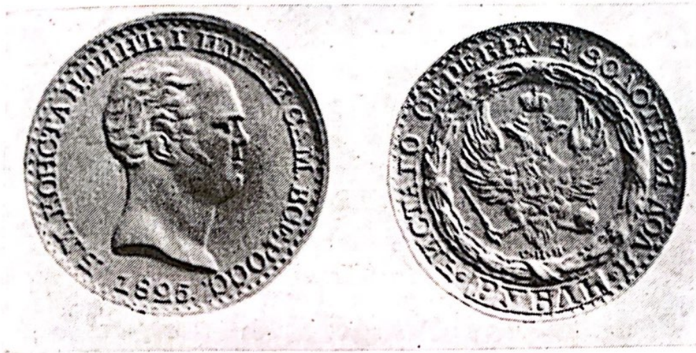
Рубль Константина. Бывший экземпляр великого князя Сергея Александровича.

Constantine rouble. Formerly in the possession of the grand duke Sergei Alexandrovitch