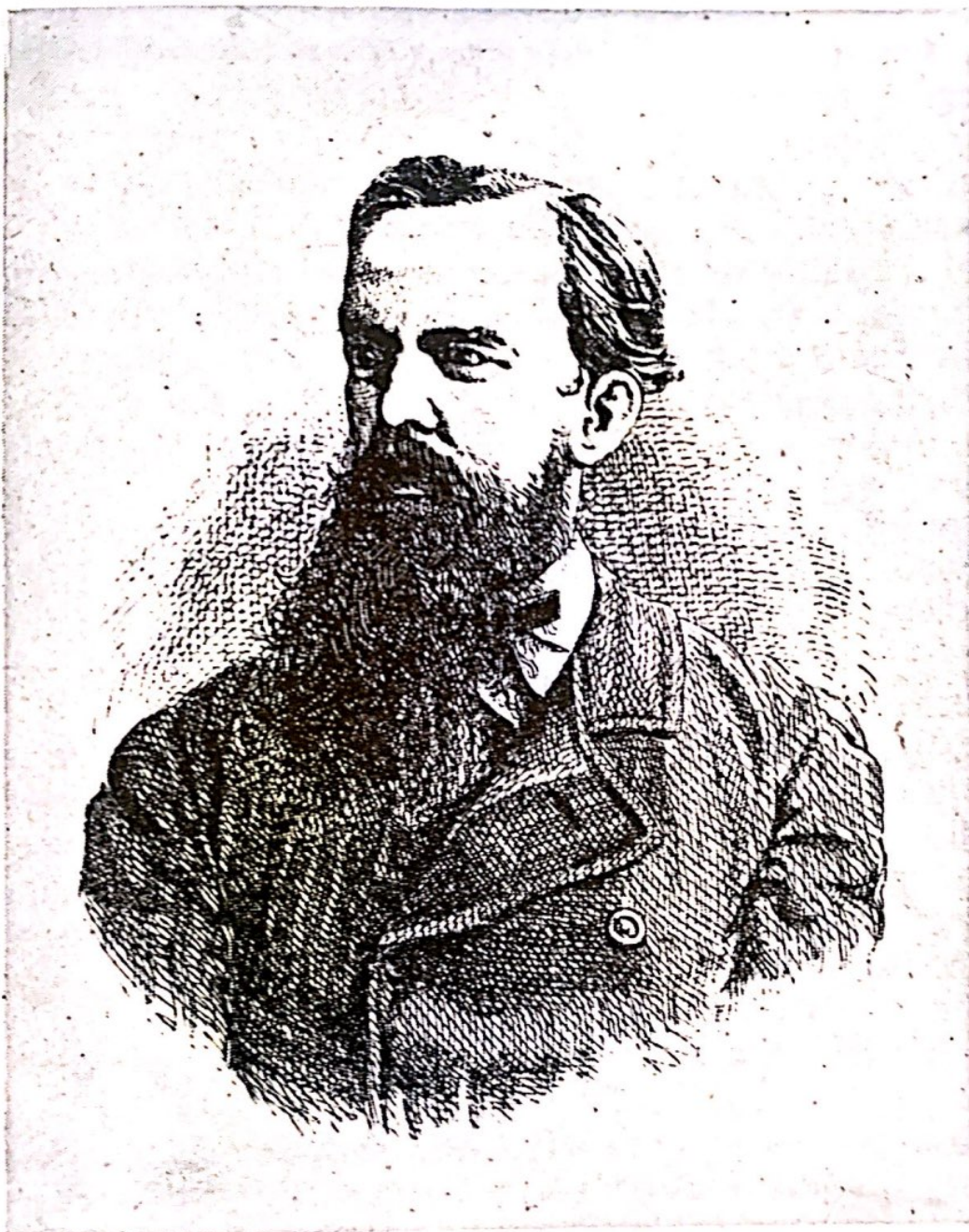
Д. Ф. Кобеко. Гравюра К. Кастелли. D. F. Kobeko. Engraving by K. Kastelli