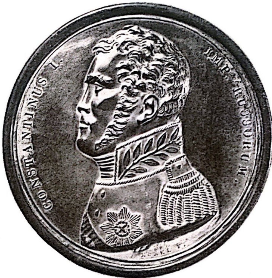
Император Константин. Односторонний медальон 1825 г. раб. Э. Морела.

Emperor Constantine. Unilateral medallion of 1825. Executed by E. Morell