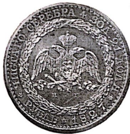
Рубль Константина 1825 г. и „рейхелевский рубль“ Николая I 1827 г.

Constantine rouble of 1825 and „Reichel rouble“ of Nicholas I, 1827