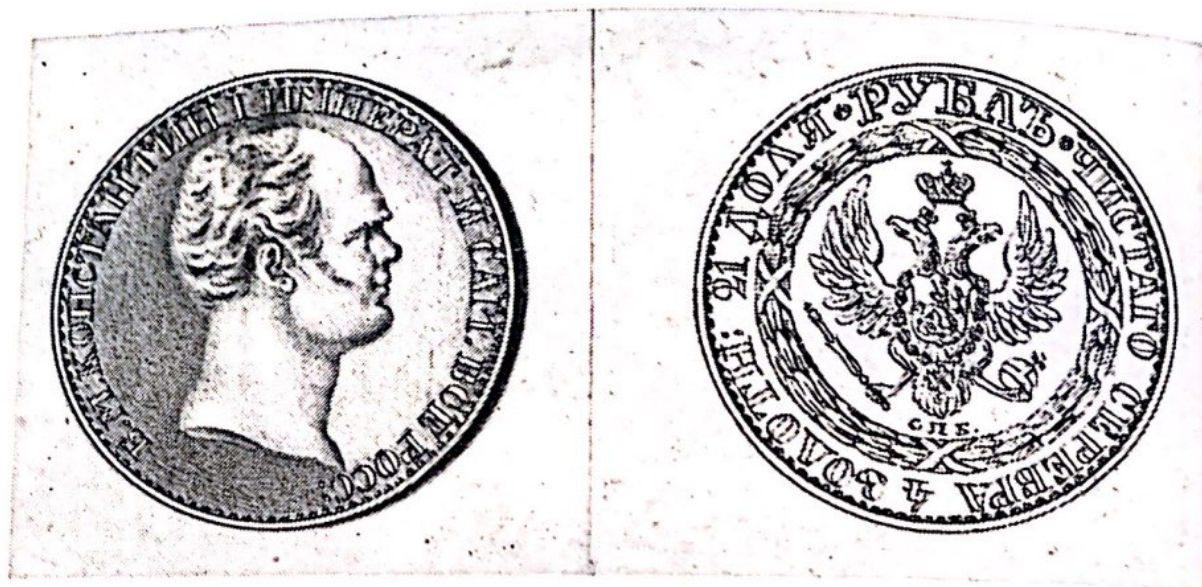
Проектные рисунки для рубля Константина.