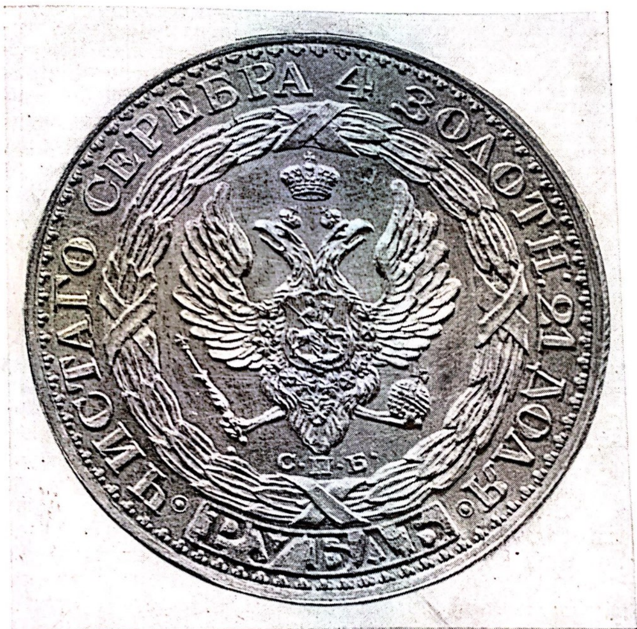
Поддельный рубль. The counterfeit rouble

прямых, а в начертании В, Р, Б, Ъ и Ь дуги имеют более плавный, круглящийся изгиб, чем на подлинной монете. Особенно же бросаются в глаза цифры в надписях обеих сторон и в дате под обрезом портрета. Единицы — с острым завершением на оригинале —