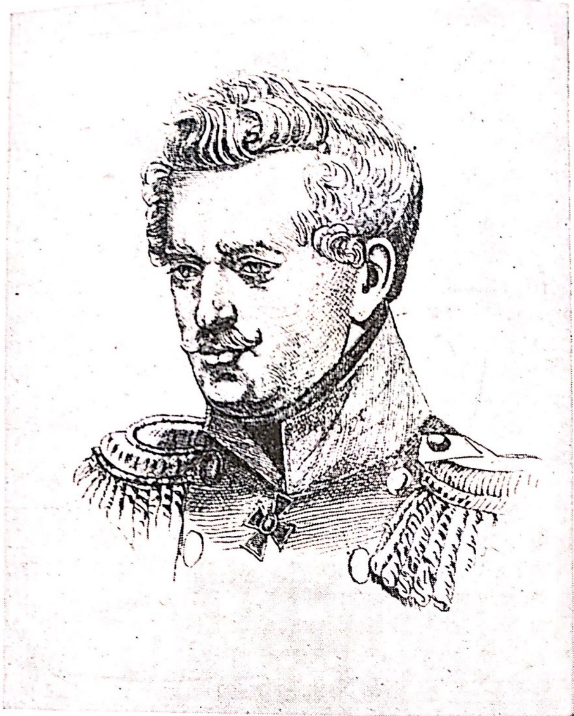
Ф. Ф. Шуберт. Гравюра К. Кастелли.