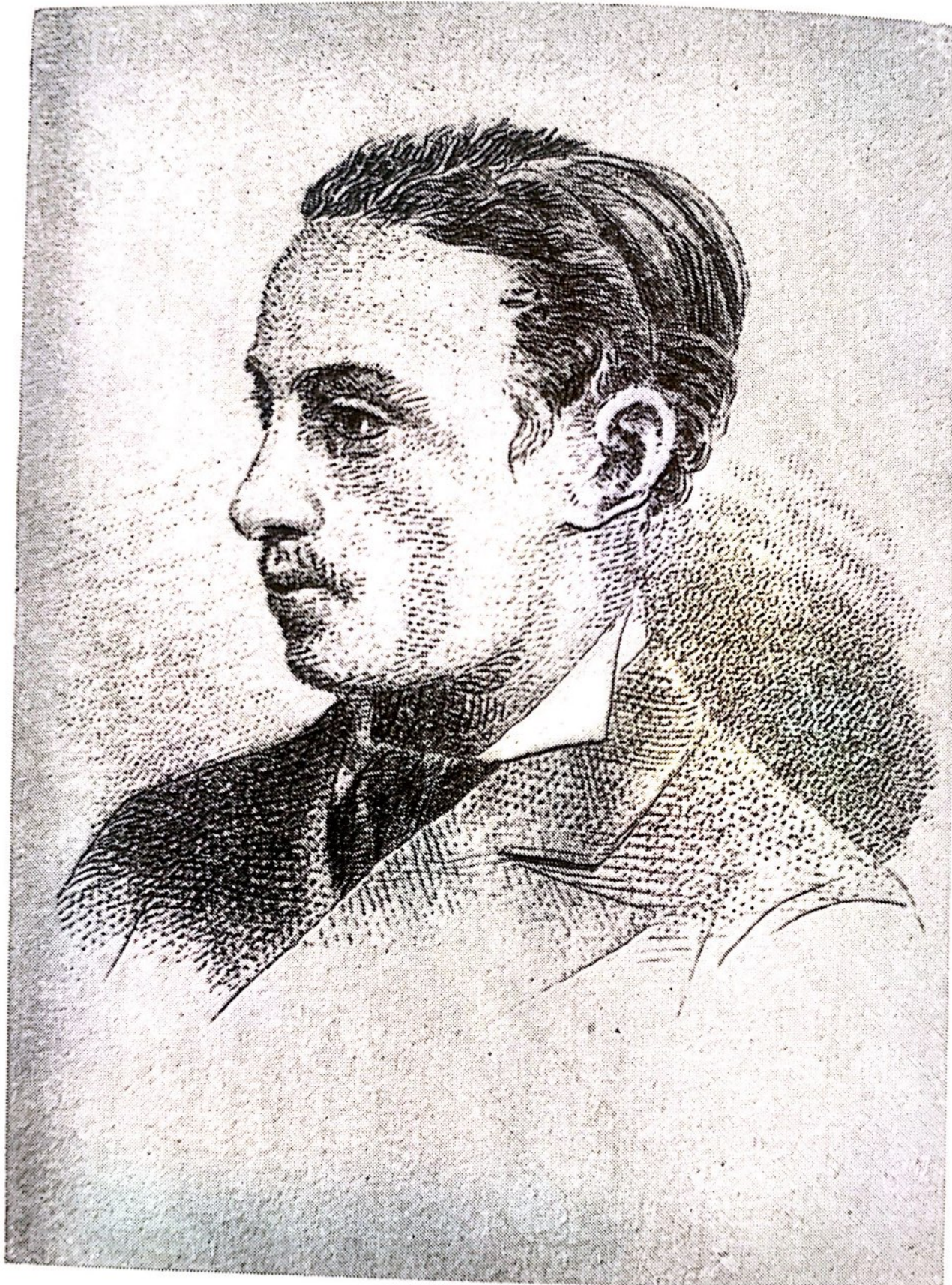
И. И. Толстой. Гравюра К. Кастелли. I. I. Tolstoy. Engraving by K. Kastelli